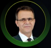
Mehmet Emin KARAAĞAÇ

Türkiye Cumhuriyet Merkez Bankası'nın eski Başkanı