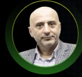
Şakir Ercan GÜL

Türkiye Cumhuriyeti Merkez Bankası Eski Genel Müdür Yardımcısı